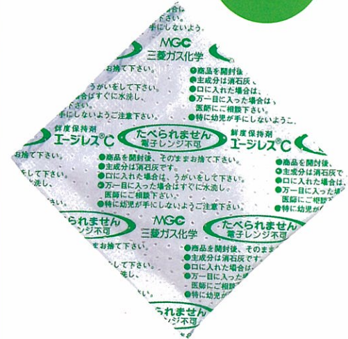
エージレスC C-250PS (原寸)